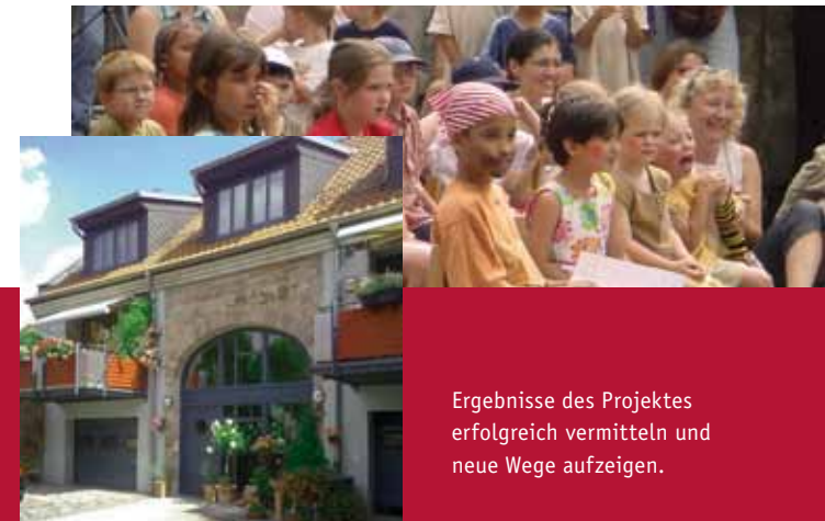
Ergebnisse des Projektes erfolgreich vermitteln und neue Wege aufzeigen.

Anhand einer Handreichung für die Verwaltungen sowie einer Informationsbroschüre werden die Ergebnisse des Projektes vermittelt und zukunftsorientierte Handlungsmöglichkeiten aufgezeigt. Projektbegleitende Veranstaltungen sowie eine neu konzipierte Wanderausstellung dienen ebenfalls der Information von Bürgern, Bauherren und Eigentümern.