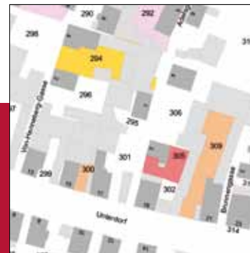
Vorteile der Innenentwicklung für Bürger und Kommunen nutzen.

Damit werden die Ortszentren belebt und aufgewertet. Vorhandene Infrastrukturen wie Schulen, Kindergärten und Geschäfte können langfristig und für künftige Generationen gesichert werden. Ein lebendiges Wohnumfeld für jung und alt bleibt erhalten. Gleichzeitig werden Neubaugebiete auf der grünen Wiese eingespart und damit Kosten für Herstellung und Unterhalt von Infrastrukturen vermieden. Nicht nur die kommunalen, auch die privaten Haushalte werden weniger belastet. Wertvolle Böden für die Landwirtschaft, schützenswerte Naturräume und Erholungsflächen bleiben erhalten.