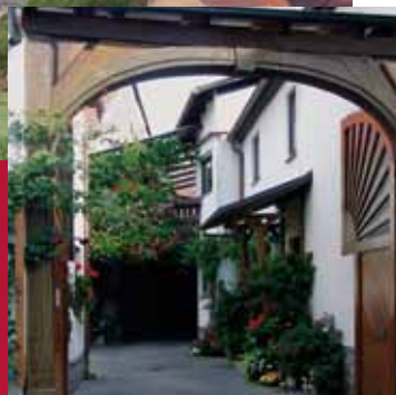
Innenbestand der Städte und Gemeinden nachhaltig sichern.