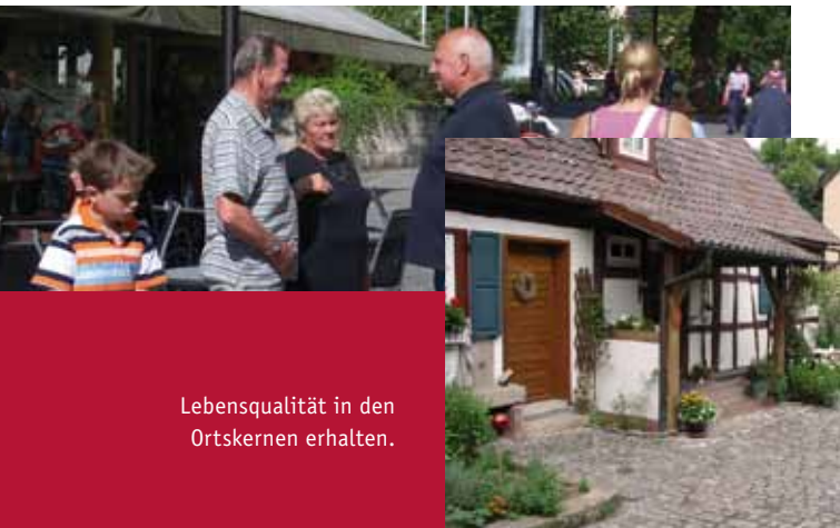
Lebensqualität in den Ortskernen erhalten.

Infolge davon sind bereits leerstehende Wohn- und Wirtschaftsgebäude sowie Baulücken in den Ortszentren vorzufinden. Zudem ziehen junge Familien bevorzugt in Neubaugebiete am Siedlungsrand, die auf den ersten Blick den Ansprüchen an moderne Wohnformen besser gerecht werden. Es droht der Verlust lebendiger Ortszentren mit Nahversorgungsangeboten sowie Kultur- und Bildungseinrichtungen. Dieser Entwicklung gilt es entgegen zu wirken, um die Lebensqualität in den Ortskernen auch zukünftig zu gewährleisten und flexible Siedlungs- und Infrastrukturen zu erhalten!